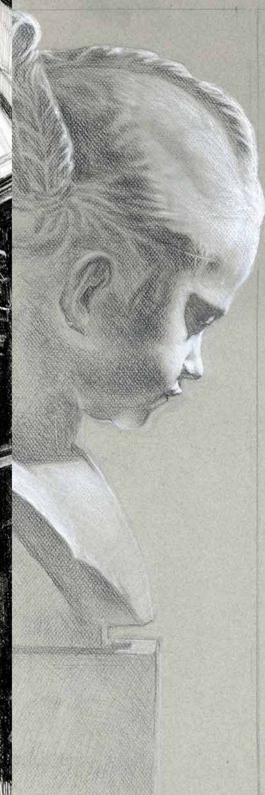
Giancarlo Pirelli - 2 e année Dessin de plâtre