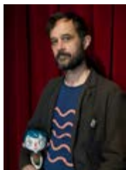
Claude Barras (promotion 1996), réalisateur de films d'animation

« Je me souviens que les professeurs nous poussaient très loin dans l'apprentissage académique, avant de nous pousser à trouver notre propre chemin et à inventer des choses nouvelles.