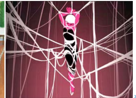
1 Antonin JURY 5 e année jeu vidéo