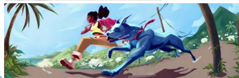
1 Adrien LUCAS 4 e année jeu vidéo